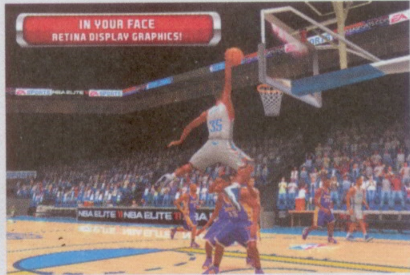
配合Retina螢幕，入樽一刻高清重現！

等到頸都長埋，EA終於把《NBA Elite 11》的bugs修正了，大家可以不用再擔心運行遊戲時會花畫面、或者看不見分數欄的問題了，而且暫時來說、在iPhone平台上，實在仍沒有一款籃球遊戲真正及得上《NBA Elite 11》，所以大家還是乖乖的先向EA投降吧！相對於上一集，遊戲除了在畫面、音效、操作、流暢度和球員資料等各方面作出應有的改善外，亦加入了一些傳奇性的隱藏人物，讓大家更投入到聯賽使用。