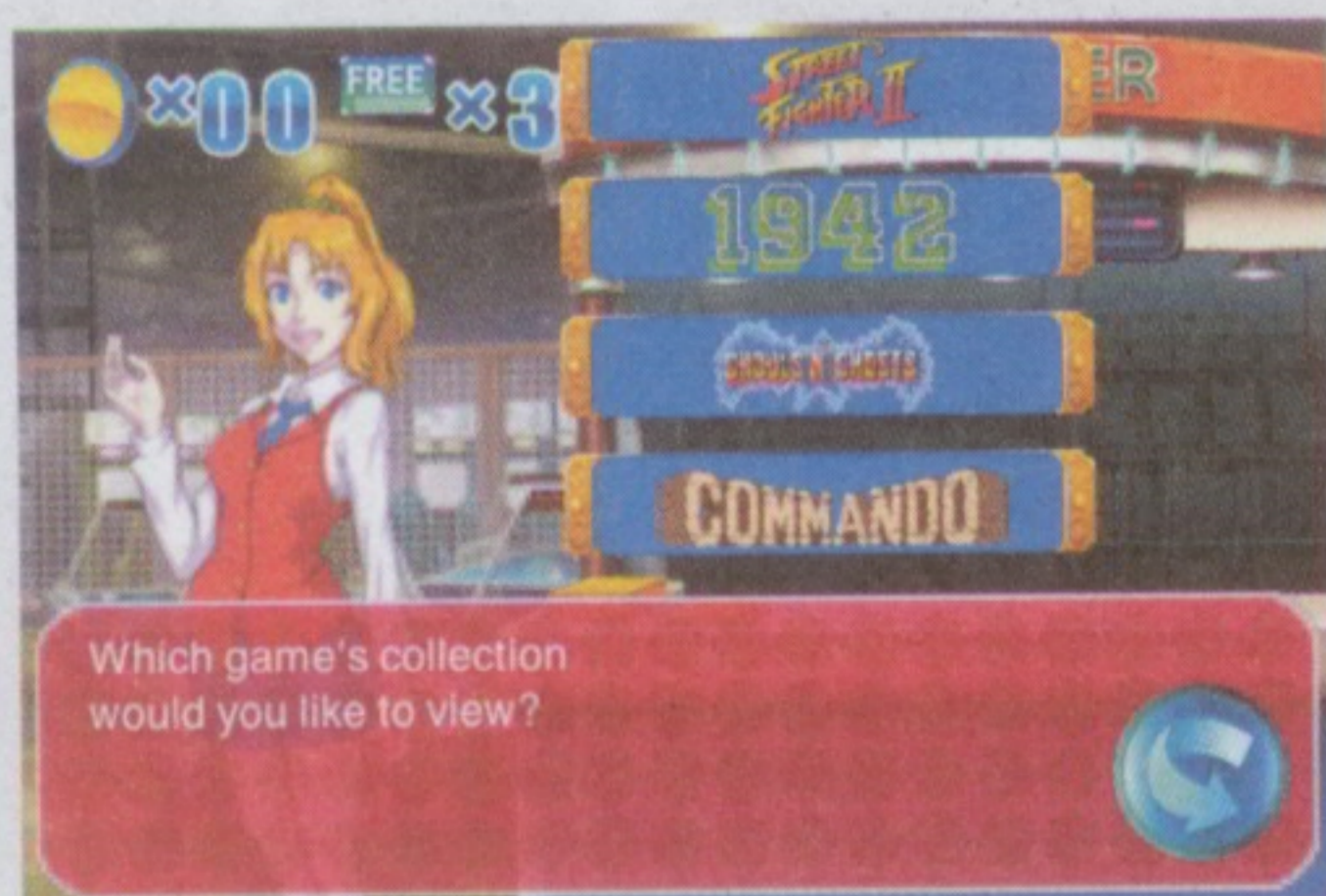
四款名噪一時的的CAPCOM經典街機大作