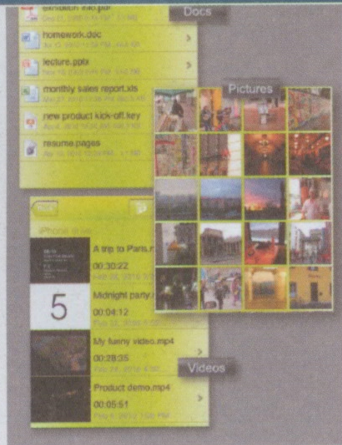
以後可直接在iPhone上瀏覽各種不同類型的檔案了！

在iPhone上要找一款功能齊備又實用的檔案管理App，真的說易不易、說難不難，因為大多的這類軟件，管理檔案得來、又開不了它們；開到檔案得來、又認不了多少格式，所以如果你也曾遇過這個問題，便要留心以下介紹的這個工具App了！《OrganiDoc》是一款結合手機內存、雲端硬碟和郵件附檔的強勢三合一檔案管理工具。除了自由新增檔案資料夾、並經由iTunes直接匯入檔案到手機管理外，《OrganiDoc》更可以助你把上傳到Google Docs或Dropbox的檔案，即時經由網絡下載到手機、用作閱讀或與朋友分享之用，可謂極其方便之致。