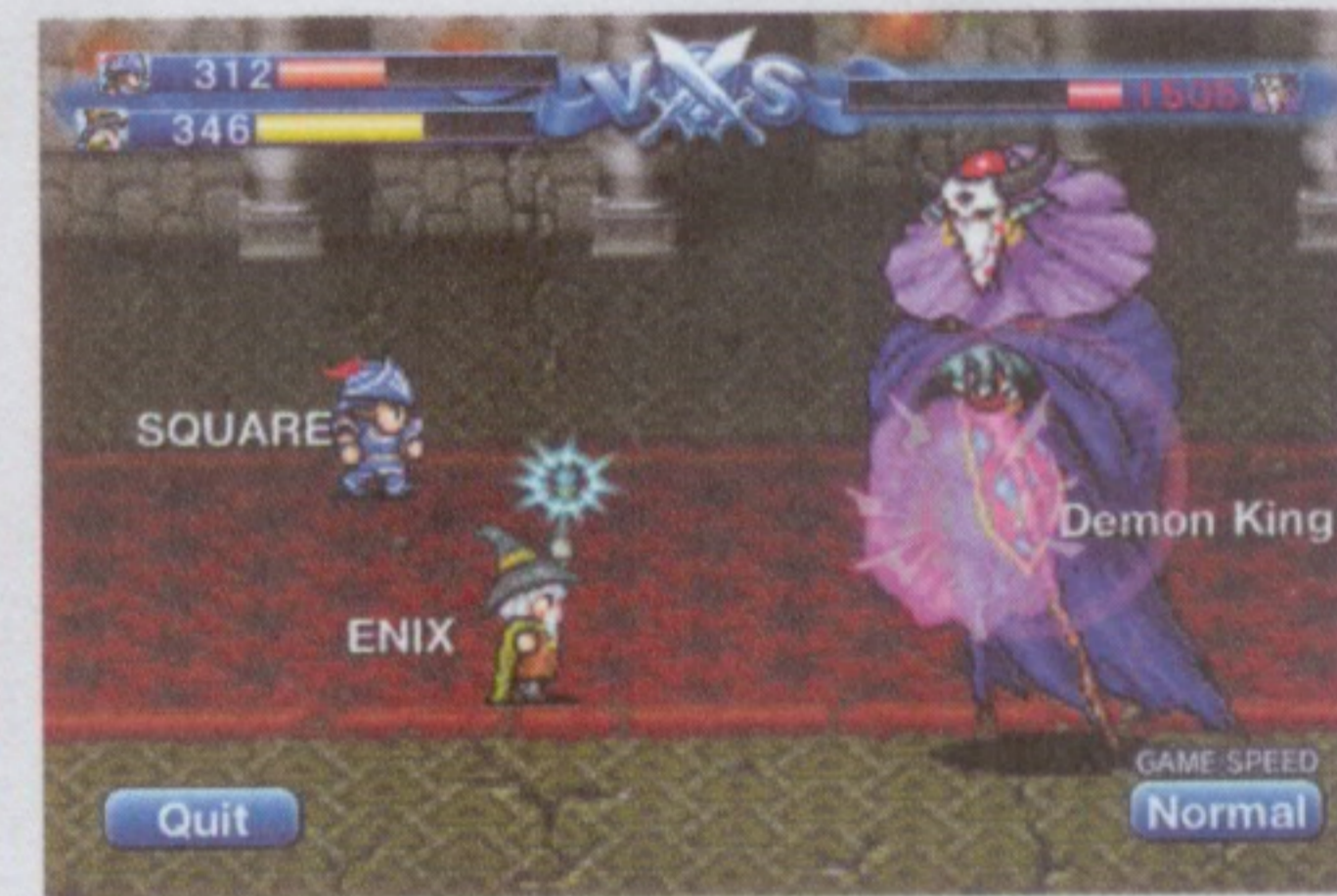
雖然只有簡單的戰鬥，但整體蠻是頗刺激有趣的，喜歡養成勇者的朋友就不要錯過了

另一款使用聲音操控角色的遊戲，不過今次是由大廠Square Enix所推出，除了日文外，幸好遊戲也同時提供英文語言選擇，不然一開始真的摸不著頭腦怎樣開始遊戲遊玩。在《Voice Fantasy》中，你需要錄下不同的聲音來召喚各種不同技能的人物。遊戲包括了：單對單的「Single Match」、二對二的「Tag Match」和與怪物對戰的「Demon King」模式，讓你把自己建立的角色慢慢培育成長。