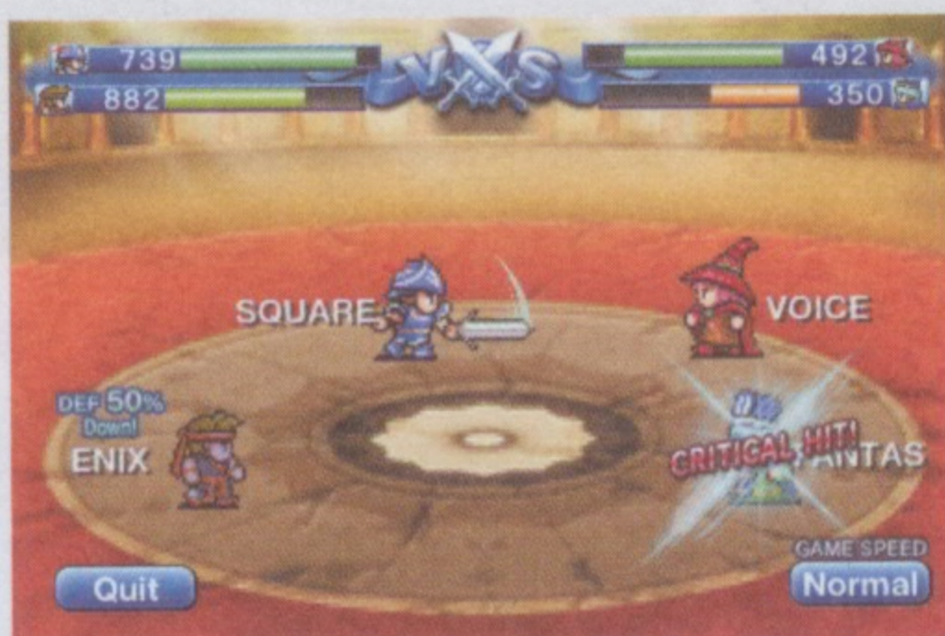
達成角色一些特定的聲音條件，便可以觸發特殊功能