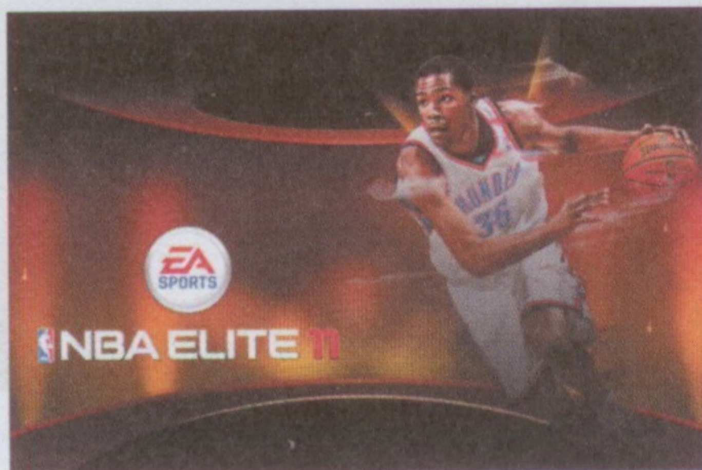
雖然姚明已經有限度復出、但火箭今年至今仍是……