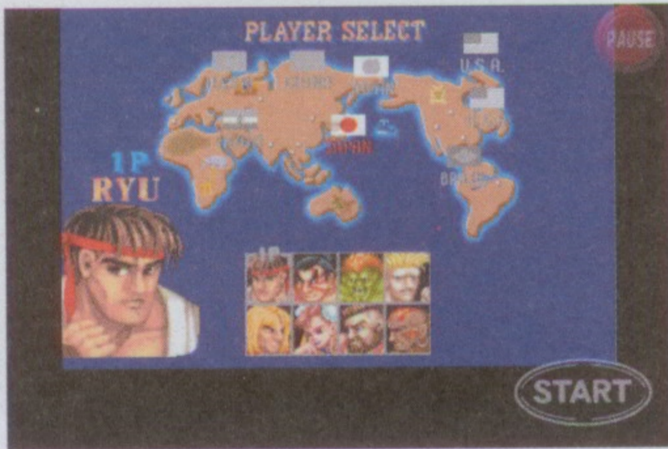
真的讓人回味無窮啊！

CAPCOM最新推出的炒集錦「免費」遊戲，讓你一再重溫兒時玩過的各款經典CAPCOM遊戲。在《CAPCOM ARCADE》中，你可以發現《街頭霸王2》、《1942》、《魔界村》和《Commando》這四款不同類型的經典街機遊戲，但留心啊！你一天只有三個免費的街機硬幣可以使用，一用光了、便要等另一天才有三個新的免費硬幣可以使用，如果真的興之所致，玩到停不了手，便唯有購買付費硬幣……或者使用快速調較時間大法吧、哈哈。